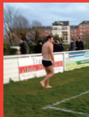
Le gage du week-end par François Foucault