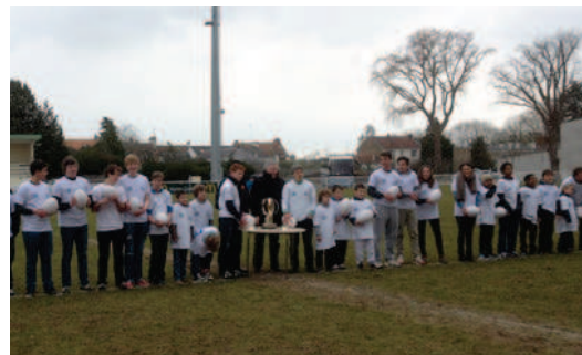
Lancement J-100 de la Coupe du Monde des moins de 20 ans par l'Ecole de Rugby avec le trophée

La réserve conforte sa bonne 4 ème place au classement grâce à sa victoire 38 à 0. On y croit pour les Plays-offs...!!!!