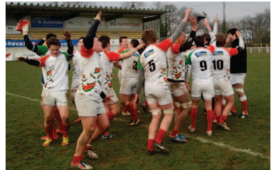
La danse de la victoire !