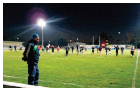
Mitou Fourcade, de retour sur les terrains ?